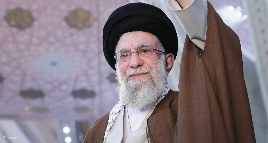
رهبر معظم انقلاب اسلامی :

هفته نامه فرهنگی سیاسی انتظار نور | گستره توزیع: سراسری سال دوم | شماره ۱۵ | ۱۸ خرداد ۱۴۰۲ | ۴ صفحه | ۲۰۰۰ تومان